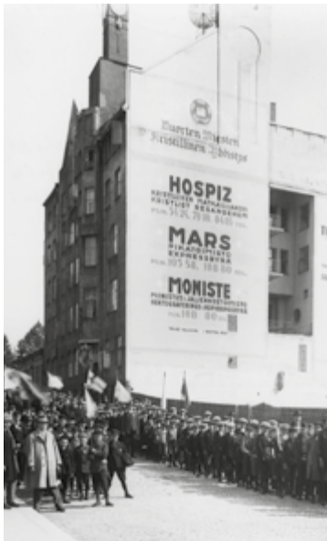
Hospiz oli Nuorten Miesten Kristillisen Yhdistyksen matkustajakoti Helsingin Kaisaniemessä. Nykyään samalla paikalla toimii Hotelli Arthur, jossa on Aino Kallaksen nimikkohuone.