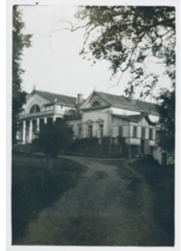
Aino Kallas vietti lapsuudenkesiään sukukartanossa Kiiskilässä Viipurinlahden rannalla, minne Krohnin sukua kokoontui eri maista. Kiiskilän kartano oli Kallaksen mielessä esikuvana, kun hän suunnitteli Kallastetta, omaa huvilaansa.

Elämää Kallasteella varjostivat myös ulkoiset uhat, ensimmäinen maailmansota. Elokuussa 1915 Kallas kertoo päiväkirjassaan: ”Illalla seisoin loggiassa, terävä kuu kumotti, koira haukkui, naapurimme katonharjan yllä loisti suuri, kirkas tähti. Olisiko tämä elämänmuoto siis lopussa? Olen koettanut luoda muutaman kuutiometrin kauneutta – kun kotini häviää, häviää osa elämäntyöstäni, itsestäni.”