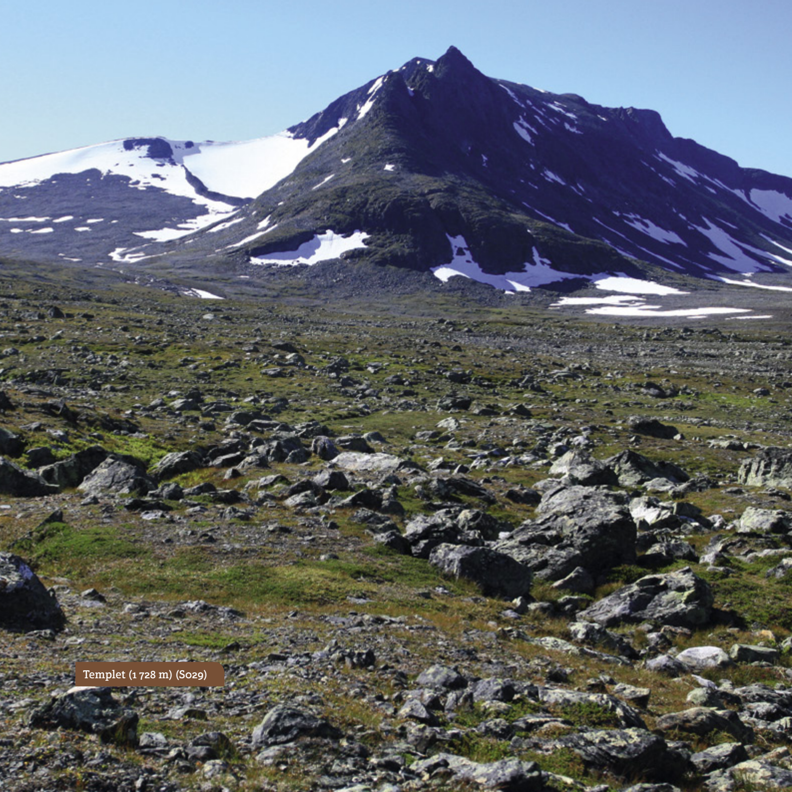
Templet (1 728 m) (So29)