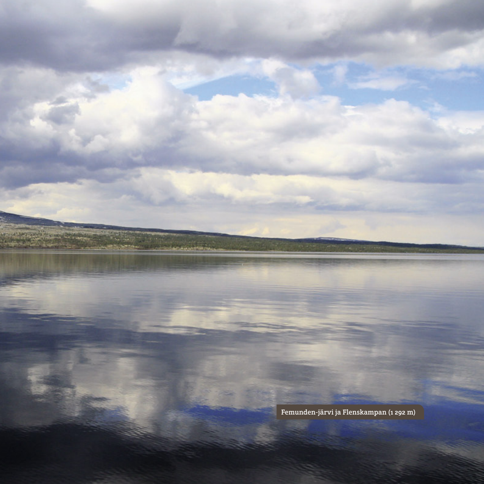
Femunden-järvi ja Flenskampan (1 292 m)