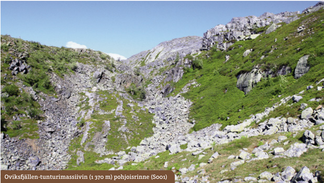
Oviksfjällen-tunturimassiivin (1 370 m) pohjoisrinne (S001)

Laskeudutaan rinnettä alaspäin ja ohitetaan polunviitta Hundshögenille. Kesämerkitty polku eroaa talvimerkeistä ja sukeltaa tunturikoivikkoon muutuen osin kivikkoiseksi kulkea. Polku päättyy kärrytielle, jota kuljetaan T-risteykseen ja käännytään vasemmalle. Lähes heti käännöksen jälkeen lähdetään pois tieltä (oikealle) ja jatketaan polkua pitkin, uudelleen talvimerkkien mukaan ja kuljetaan muutama sata metriä Arådalenin tuvalle.