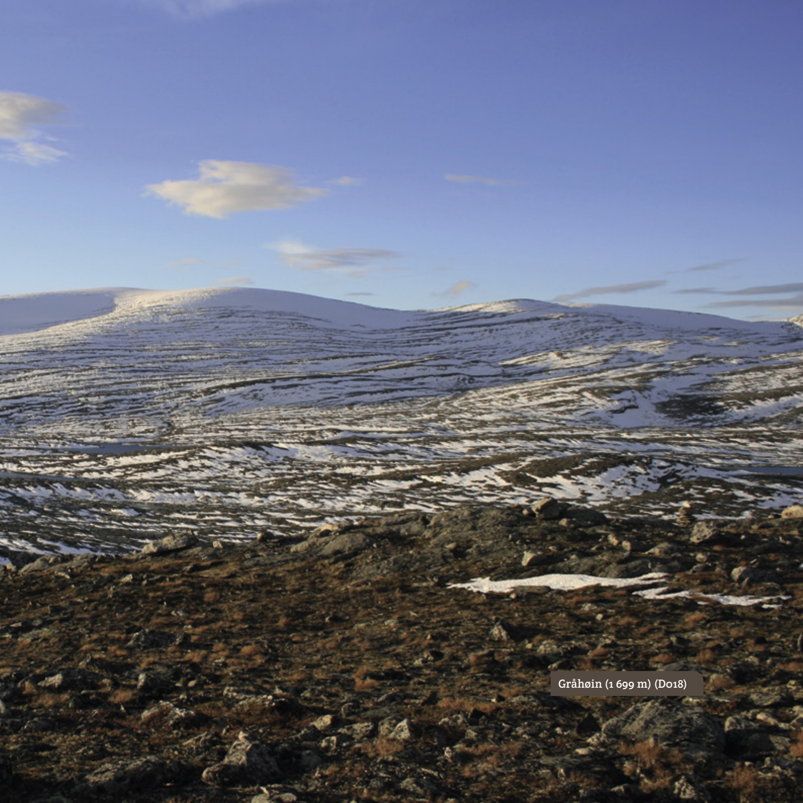
Gråhøin (1 699 m) (D018)