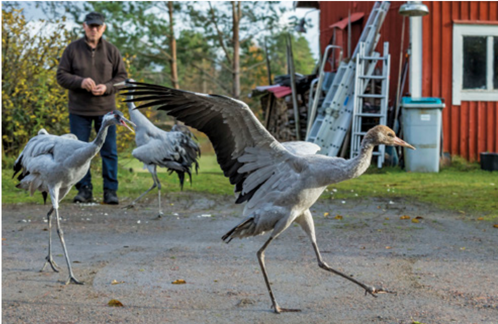
Ulkona ollessaan kurjet voivat käydä joskus satojen metrien päässä, mutta pääasiassa ne liikkuvat sadan metrin etäisyydellä kotipihasta.