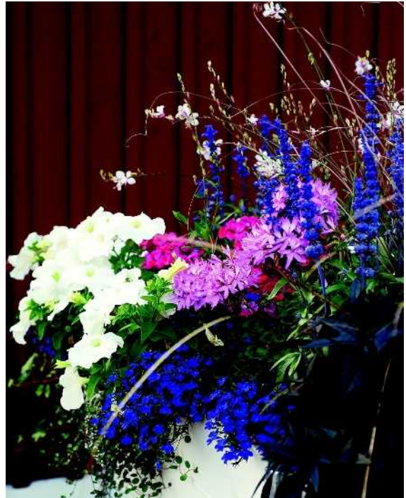
Nyt istutuksissa yhdistetään rennon ilmeen luomiseksi kesäkukkien seuraan mm. koristeheiniä ja lehtikasveja.