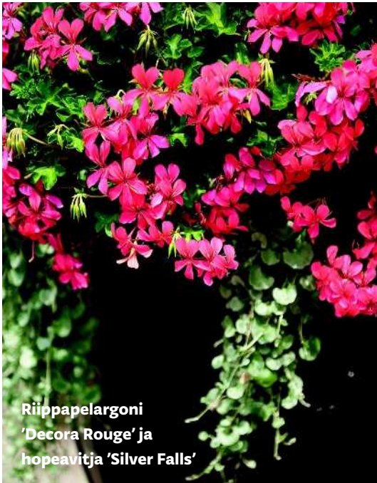
Riippapelargoni 'Decora Rouge' ja hopeavitja 'Silver Falls'