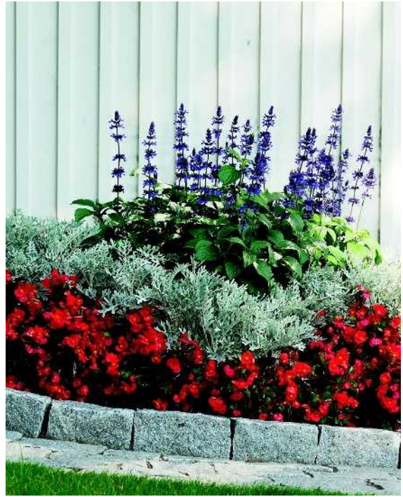
Salvia nousee esiin vaaleaa seinää vasten. Kesäkorkea kasvi on hopeavillakko 'Silver Dust' ja matalana reunuskasvina kesäbegonia 'Super Olympia Red'.