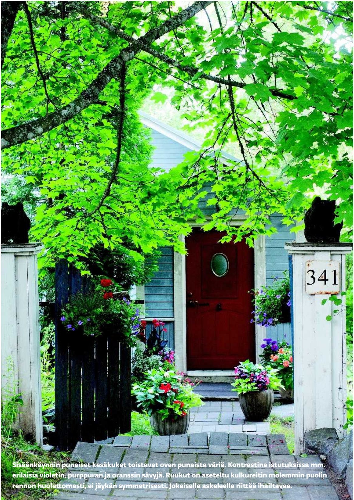
Sisäänkäynnin punaiset kesäukat toistavat oven punaista väriä. Kontrastina istutuksissa mm. erilaisia violetin, purppuran ja oranssin sävyjä. Ruukut on aseteltu kulkureitin molemmin puolin rennon huolettomasti, ei jäykän symmetrisesti. Jokaisella askeleella riittää ihailtavaa.