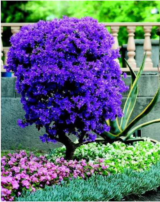
Ihmeköynnöksen eli bougainvillean alla mehikasveja ja kesäbegoniaa tapettimaisesti maanpeitteenä. Taustalla komea agave.