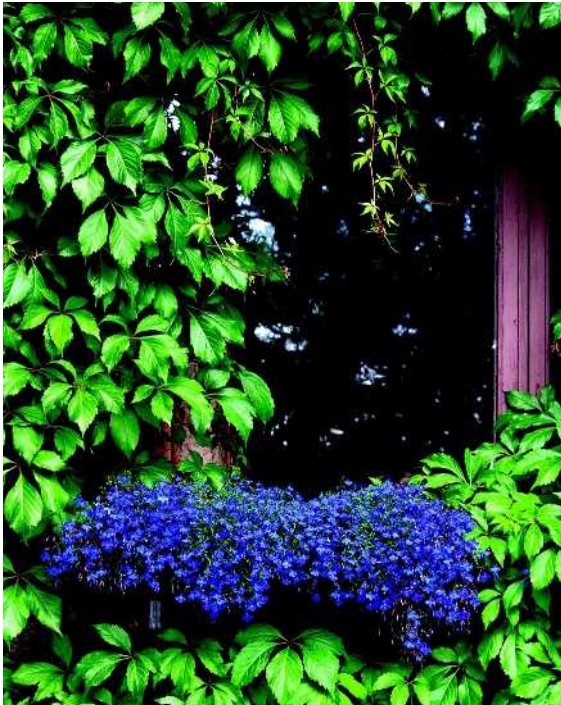
Varjoisalla paikalla, villiviinin vehreystä nousee esiin parvekelaatikollinen sinistä lobeliaa.