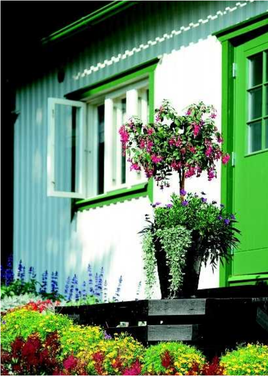
Rungollinen verenpisara tuo ryhtiä ja korkeutta istutukseen. Sen alla kasvavat tarhatähtisilmä, koristebataatti 'Illusion Midnight Lace' ja hopeavitja 'Silver Falls'.

kasvit saavat olla kauniita, herkkiä yksilöitä, joiden yksityiskohdat hurmaavat. Esimerkiksi herkkä kesäneilikka ripsureunaisin terälehdin on kaunis parvekepöydän katseenvangitsija ja siro valkoisen pelargonin, tummansinisen heliotroopin ja vaaleanpunaisen pikkupetunian seuralainen. Kauempaa katsottavat kasvit saavat reilusti herättää huomiota värein ja muodoin. Kasvin olemus voi olla ryhdikäs, ja sitä voi korostaa enemmän kokonaisuudessa ryhmänä kuin yksittäisenä kasvina. Kannojen, kesäpäivänhattujen ja daalioiden kukintojen muodot näkyvät hyvin myös etäältä. Kesäbegonioiden kukkamassa erottuu puolestaan hyvin väripintana kauempaa katsottaessa. Sen sijaan tummat värit ja siniset näkyvät huonosti kauas. Vaaleat värit, kuten vaaleanpunainen, vaaleankeltainen, valkoinen ja hopeanharmaa, erottuvat etäältä ja hämärässä.