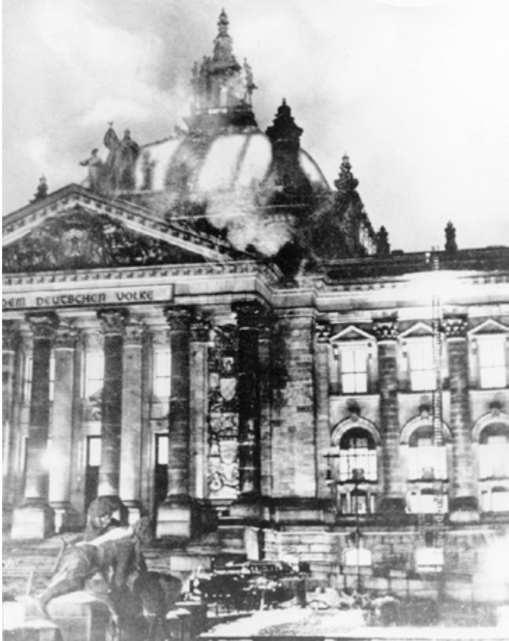
Saksan demokratian viimeinen päivä: valtiopäivätalo liekeissä 27. helmikuuta 1933.