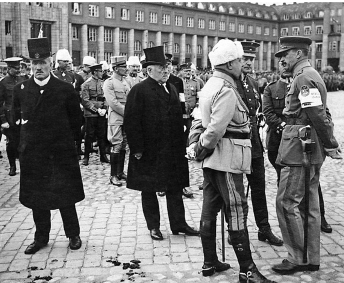
Suomen poliittisen johdon ja sotilasjohdon erilinjaisuus turvallisuuspolitiikassa juontui jo itsenäisyytemme ensimmäisiltä vuosilta.