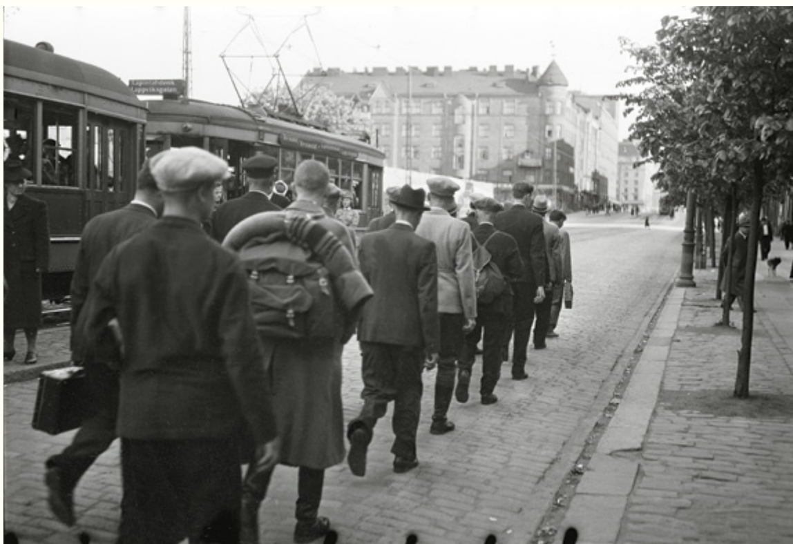
14. Helsinki, 20.6.1941.

Matkan varrelle osui lukematon joukko sodankäynnin kannalta enemmän tai vähemmän tärkeitä laitoksia: asepajat, autokorjaamot, hevostallit, keittiöt, puhelinkeskukset, viesti- ja ilmatorjunta-asetat, kenttäpostikonttorit, ammus-, muona-, rehu-, vaate-, polttoaine- ja muut tarvikevarastot, ambulanssiasemat sekä kaatuneiden ja sotasaaliin kokoamispaikat. Kaikesta tästä materiaalista ja trafikista pidettiin kirjaa. Kirjurit ja toimistoupseerit kävivät paperisotaa aseinaan lomakkeet, kirjoituskoneet ja leimasimet.