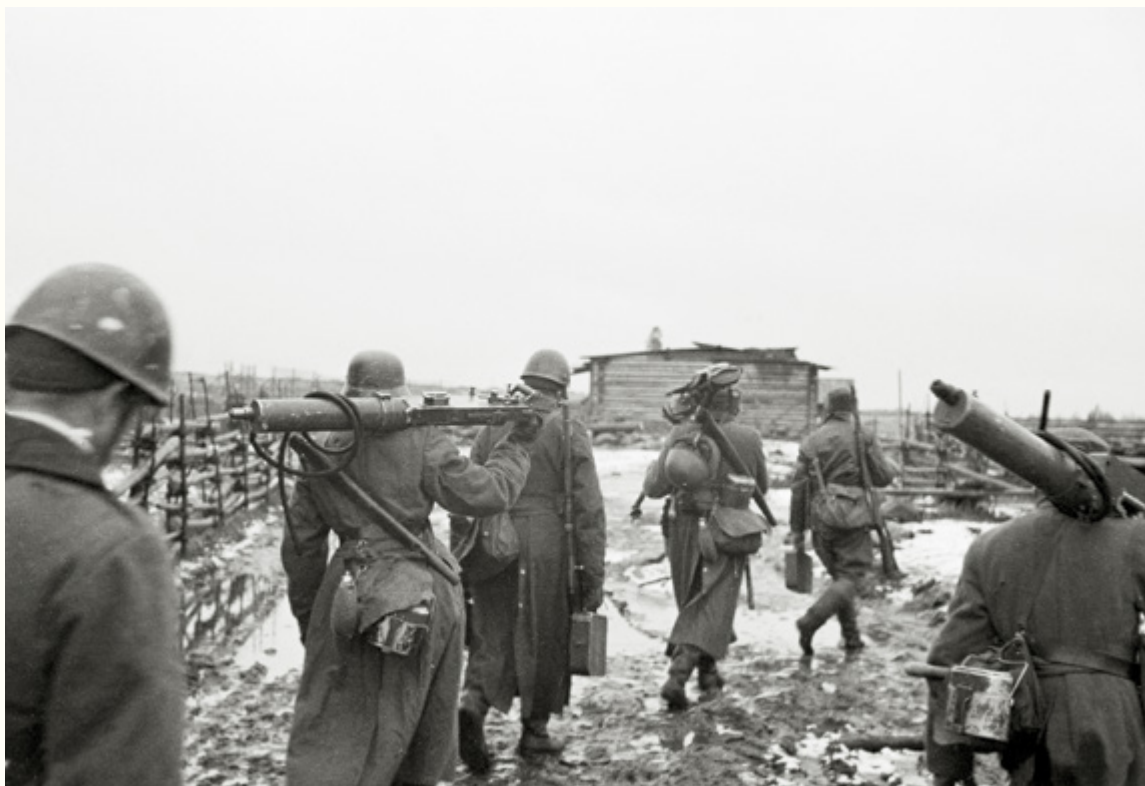
15. Soidoma, 26.10.1941.

puolustusvoimien palveluksessa oli tuolloin 34 282 naista, joista lottia oli 19 446, palkattuja naisia 9 796 ja muita naisia 5 039. Viimeiseen ryhmään lukeutuivat mitä ilmeisimmin ainakin sairaanhoitajat ja sotilaskotisisaret. Luvuissa ovat kuitenkin mukana myös kotiseudulla palvelleet naiset, joita oli kokonaismäärästä enemmistö. 2