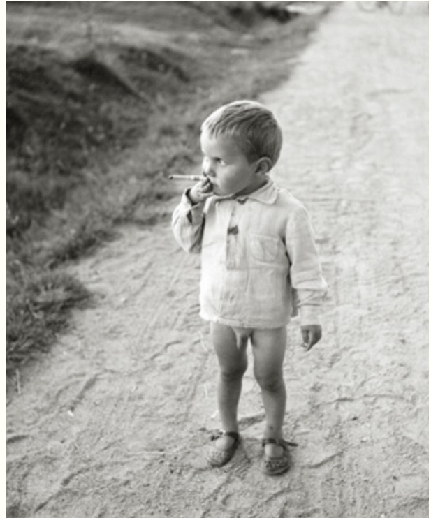
5. Viipuri, 1.5.1944.