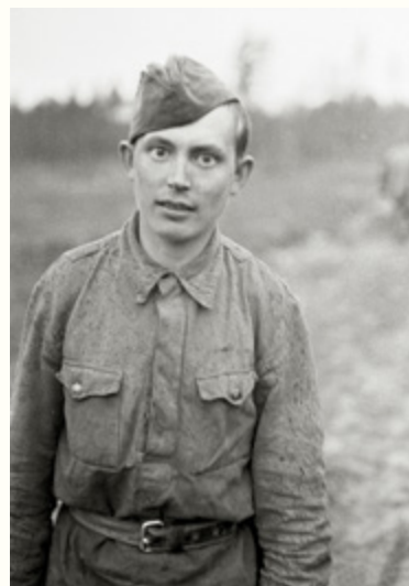
8. (viereinen sivu) Rukajärvi-vihollisen Etp., 16.12.1942.