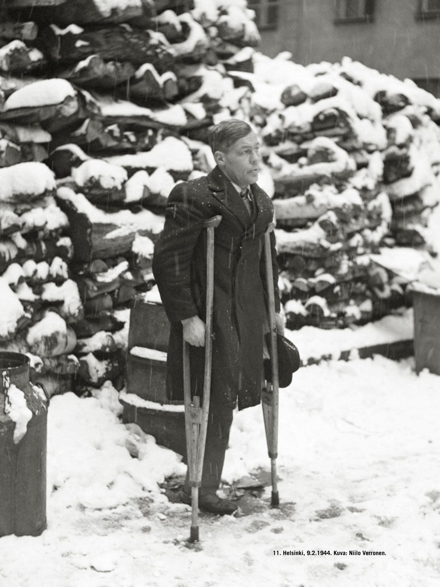
11. Helsinki, 9.2.1944.