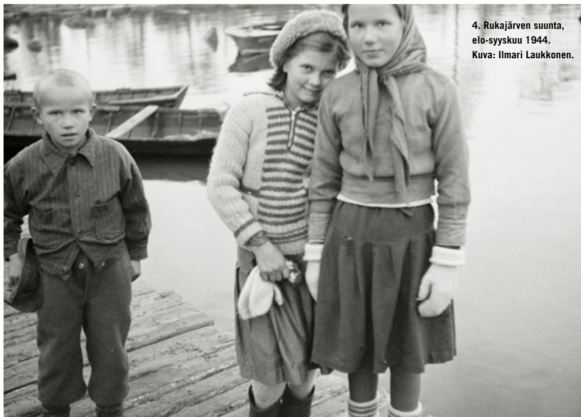
4. Rukajärven suunta, elo-syyskuu 1944.

on historiansa. Tuon ajan ihmiset eivät esimerkiksi olleet kasvaneet kulttuurissa, jossa tunteita olisi kuulunut ”käsitellä” puhumalla tai jossa suruun ja ahdistukseen olisi haettu apua psykologilta. Monelle uskonto oli luontevin tapa antaa riipaiseville menetyksille kestävä merkitys. Myös kuolema oli lähempi ja arkisempi tuttava kuin nykyisin, jolloin siihen tuntuu usein liittyvän jotain luonnotonta ja piilotettavaa. Sota-ajan ihmiset rakastivat ja kaipasivat toisiaan kuten mekin, mutta aikana ennen kännyköitä ja sähköpostia erot ja etäisyydet olivat suurempia. Monet sota-ajan raskaimmista hetkistä koettiin ratapihoilla, portinpielissä ja linja-autoasemilla, kun jälleennäkeminen verhoutui hämärään. Kirjeet olivat tärkein yhteydenpidon väline.