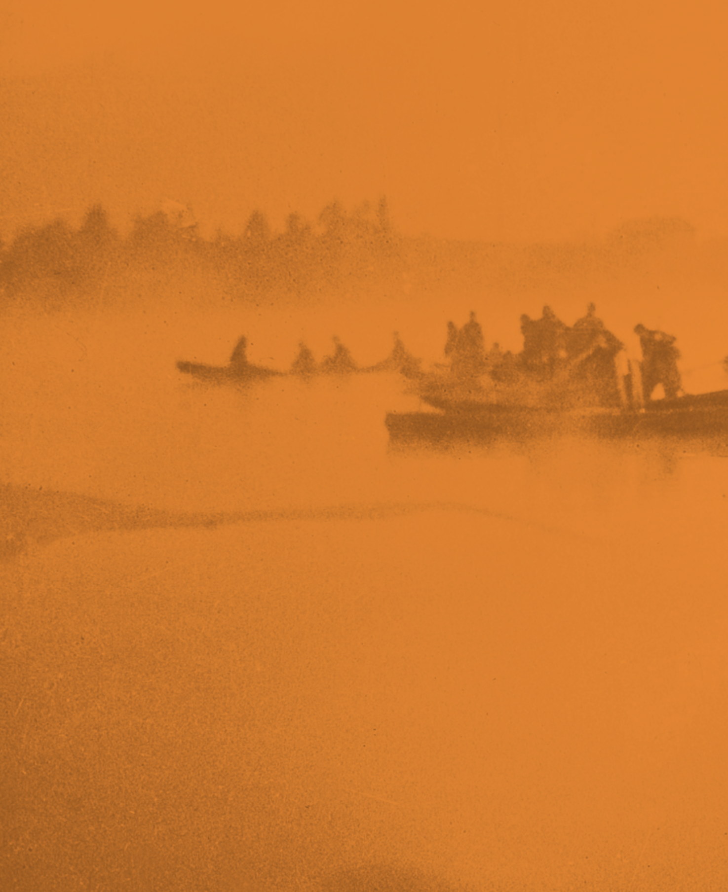
12. Syväri, 11.9.1941.