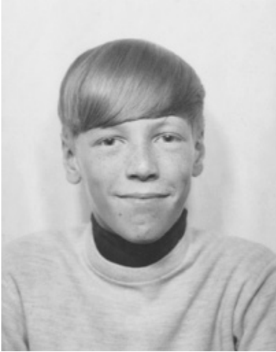
Harjoittelijaksi Sveitsiin.

”Yksikseen vieraassa maassa asuvalla 16-vuotiaalla ei ollut huolta huomisesta. Mieleen ei tullut säästää. Kun hyvän levyn