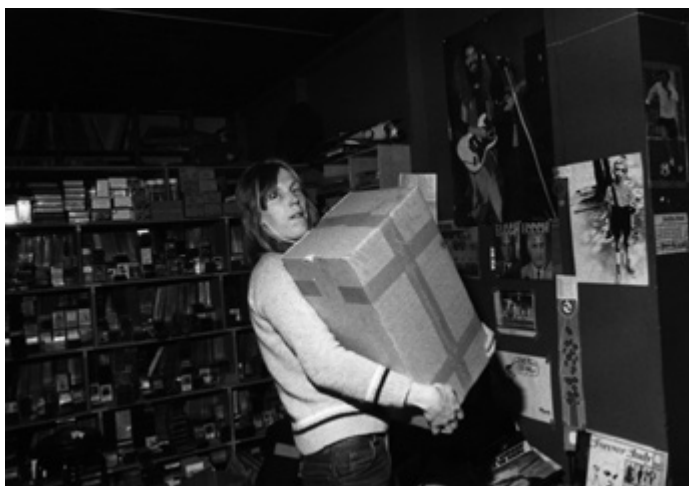
Työ levykaupassa vaati ajoittain hyvää fysiikkaa.

Puhumattakaan sitten niistä päivistä, jolloin Amerikan rahtina myymälän lattialle ilmestyi 8 000 alennusmyyntilevyä. Illan tunteina niitä sitten kannettiin ja järjestettiin kellarivarastoihin. Yhteen laatikkoon oli pakattu 150 levyä. Siihen tuli painoa nelisenkymmentä kiloa. Ja niitä laatikkoja riitti yhdeksi iltapuhteeksi useammallekin miehelle!