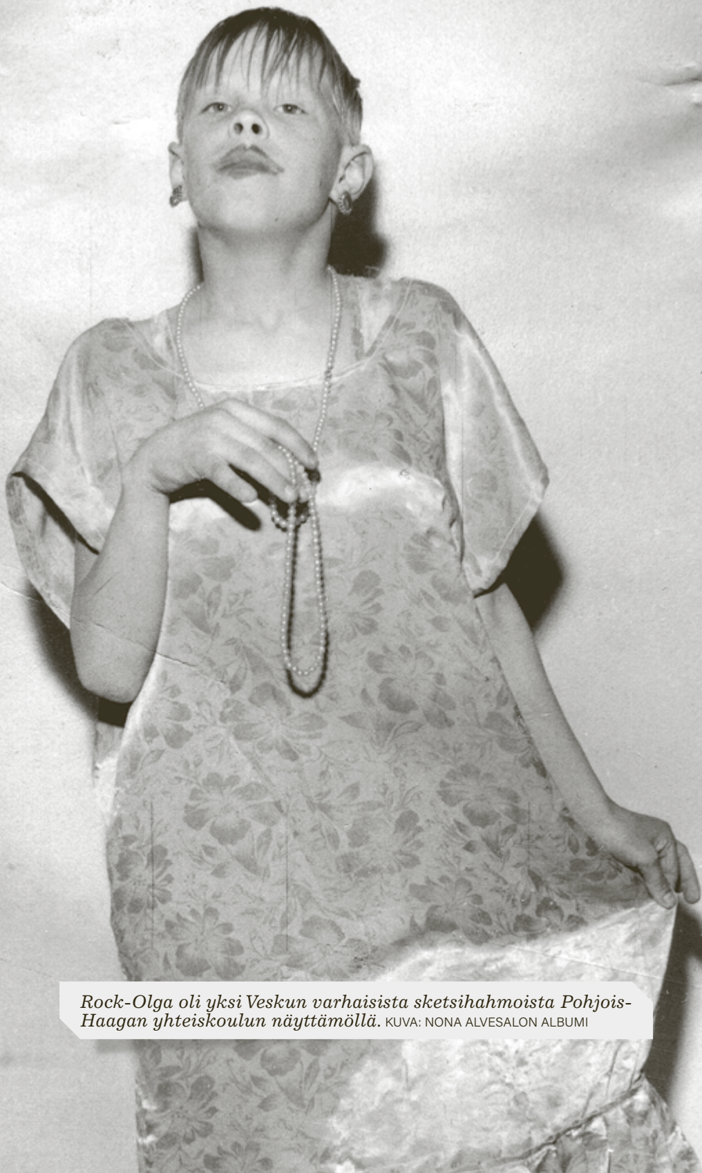
Rock-Olga oli yksi Veskun varhaisista sketsihakmoista Pohjois-Haagan yhteiskoulun näyttämöllä.