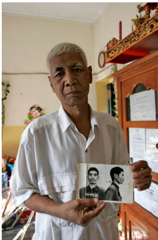
Vann Nath (1946–2011) pelastui kidutuskeskuksesta.

Rikkaan maailman edustajina me saamme joissakin kehittyvien maiden kulttuureissa kiusallisen kohteliasta kohtelua, usein aitoa, mutta usein se muistuttaa kolonialismista ja alamaisasenteisesta luokkajaosta. Onneksi se on katoamassa, ja ihmiset kohtaavat toisensa tasavertaisina.