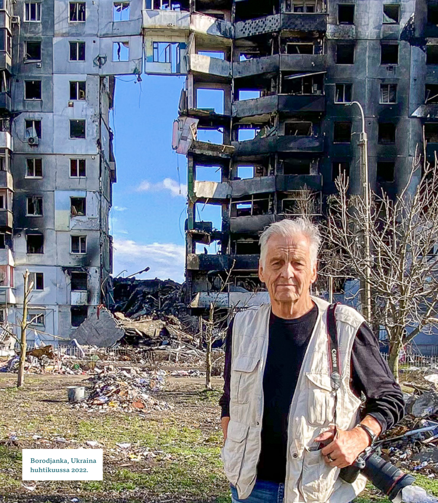
Borodjanka, Ukraina huhtikuussa 2022.