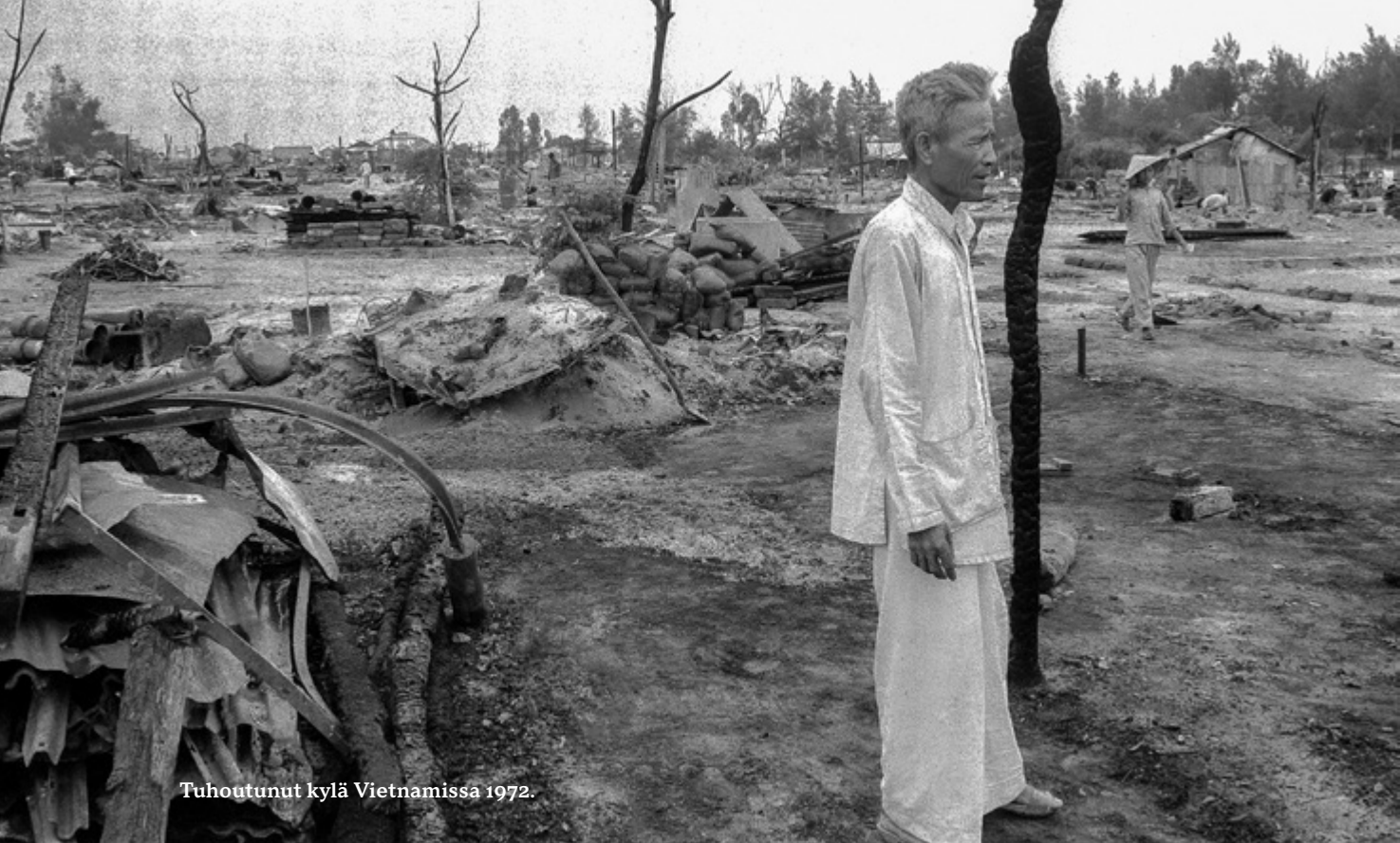
Tuhoutunut kylä Vietnamin 1972.

Ridenhour ryhtyi selvittämään tapahtunutta. Kun hänen palvelusaikansa Vietnamin 1972 vuotta myöhemmin päättyi, hän lähetti Pentagoniin, kongressiin ja USA:n hallituksen ministereille kirjeen, jossa hän kertoi Charlie-komppanian joukkueenjohtajan vänrikki William Calley surmanneen konetuliaseella aseettomien siviilien ryhmiä My Lai alueella.