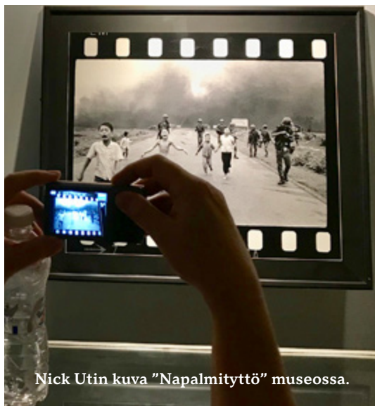
Nick Utin kuva "Napalmityttö" museossa.

Helikopterissa ampujana toiminut Ridenhour ei itse ollut Charlie-komppanian mukana joukkomurhapaikoilla, mutta hänen ystävänsä olivat, ja he kertoivat Ridenhourille operaatiosta muutamaa viikkoa myöhemmin.