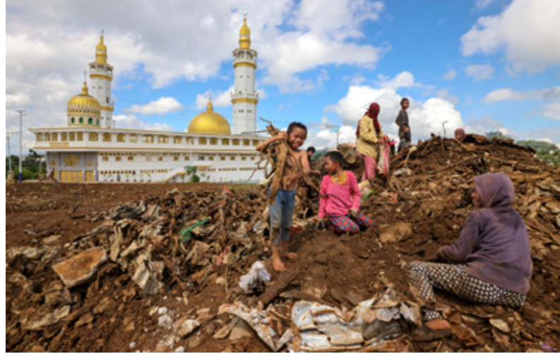
Marawi, Filippiinit 2022.

Samaan aikaan koronapandemia ja Venäjän hyökkäyssota Ukrainaan kaikkine seurauksi-