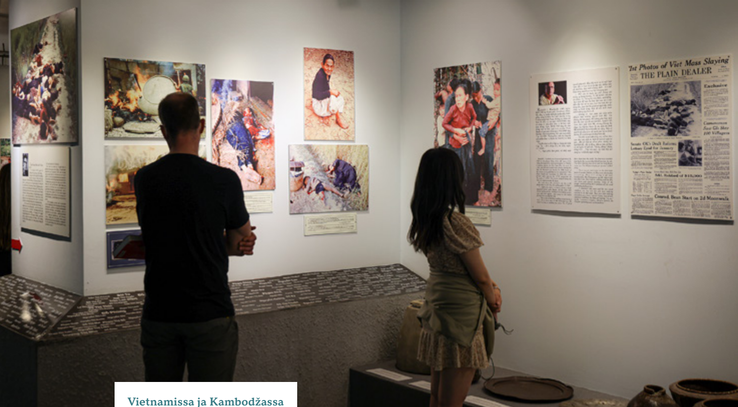
Vietnamissa ja Kambodžassa sodan muisti siirtyy nuorille.