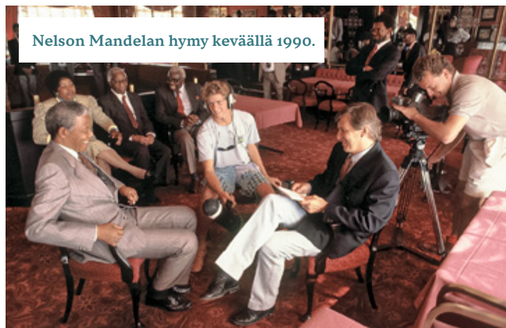
Nelson Mandelan hymy keväällä 1990.