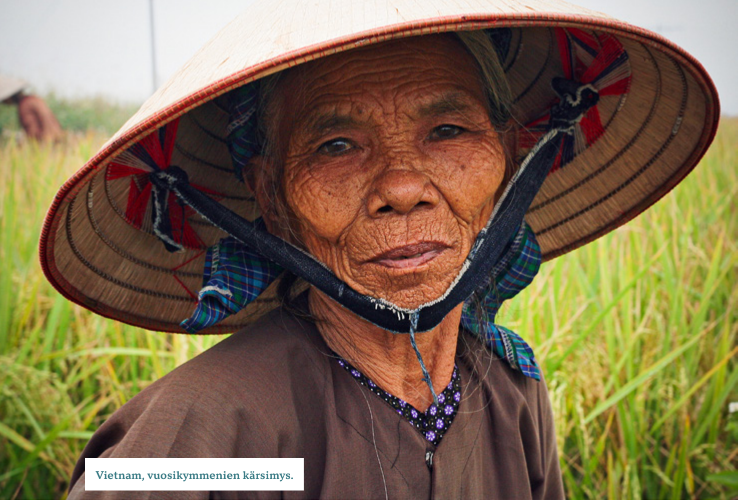
Vietnam, vuosikymmenien kärsimys.

tapaamani rouvat ovat korkean iän saavuttaneina jo poistuneet joukostamme.