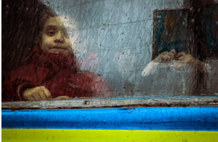
Pakolaisjuna Ukrainassa 2022.

Sosiaalisen polarisaation seuraukset ovat olleet nähtävissä kaikkialla maailmassa brexitistä Trumpiin , myös Suomessa. Poliittinen populismi voi hyvin vastakkainasettelun täytämässä maailmassa.