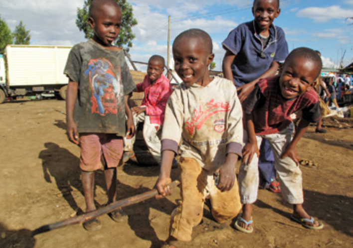
Kibera, Kenia 2013.

ja intialaiset olivat optimisteja. Pessimismin syiksi lueltiin sota ja konfliktit, heikentynyt taloudellinen tila, köyhyys ja korruptio.