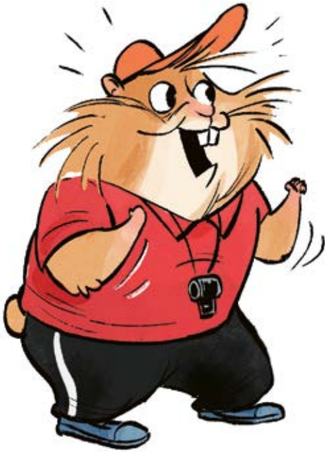
Koutsi Hakala Säbähamstereiden valmentaja