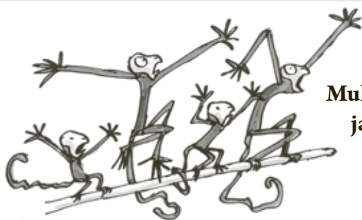
Mukkelis-Makkelis ja muut apinat