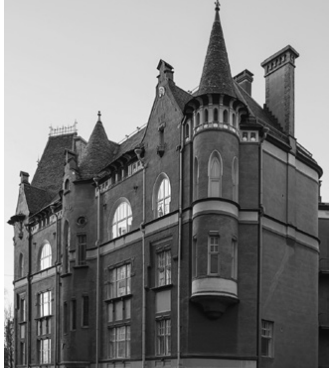
Geselliuksen, Lindgrenin ja Saarisen suunnittelema talo (1897) Luotsikatu 1:ssä. Sen ”tutunoloinen” erkkeritorni näkyi suoraan vastapäiseen Janssonin lapsuudenkotiin.

Kyse oli ilmeisesti Vasikkasaaren räjähdyksestä 1919. Suomenlinnan ja Santahaminan välisellä saarella räjähti ammusvarasto