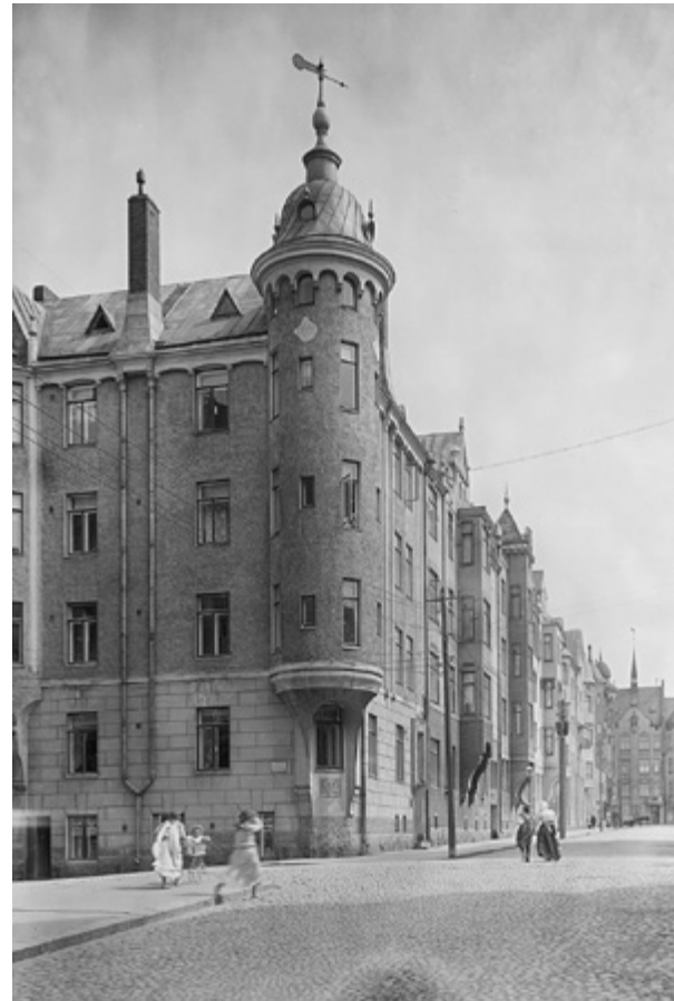
Myös Luotsikatu 7:ssä (B. F. Granholm, 1903) oli kulmatorni, jonka tuntuisi voivan irrottaa omaksi pyöreäksi talokseen.

Kuvanveistäjän tyttären tapa antoi muistettavan kohdan. Eräänä vuonna torilla ei ollut tuomenoksia. Perheen kotiapulainen Anna keksii, että puistossa on valkoinen tuomi. Siitä voi käydä ottamassa,