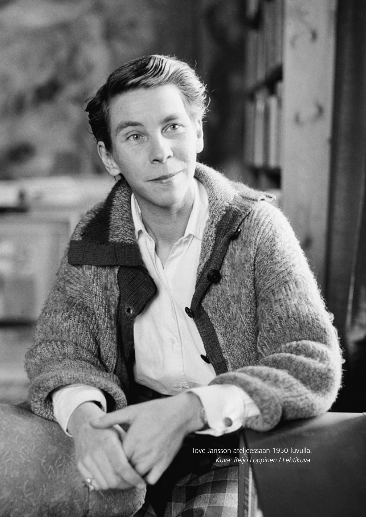
Tove Jansson ateljeessaan 1950-luvulla.