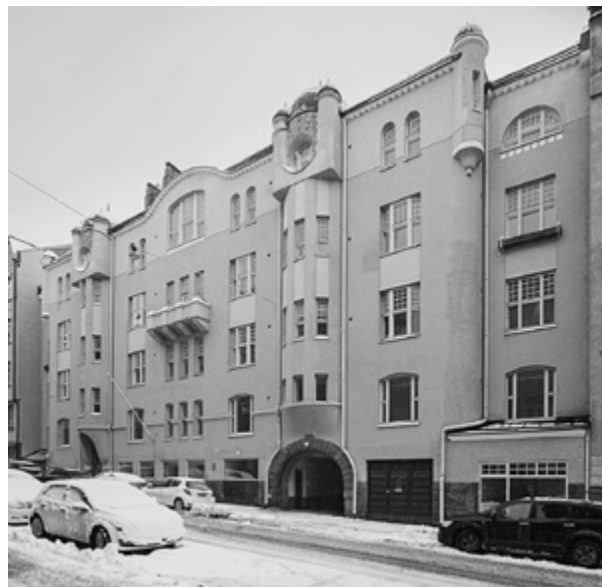
Tove Janssonin lapsuudenkoti Luotsikatu 4:ssä.