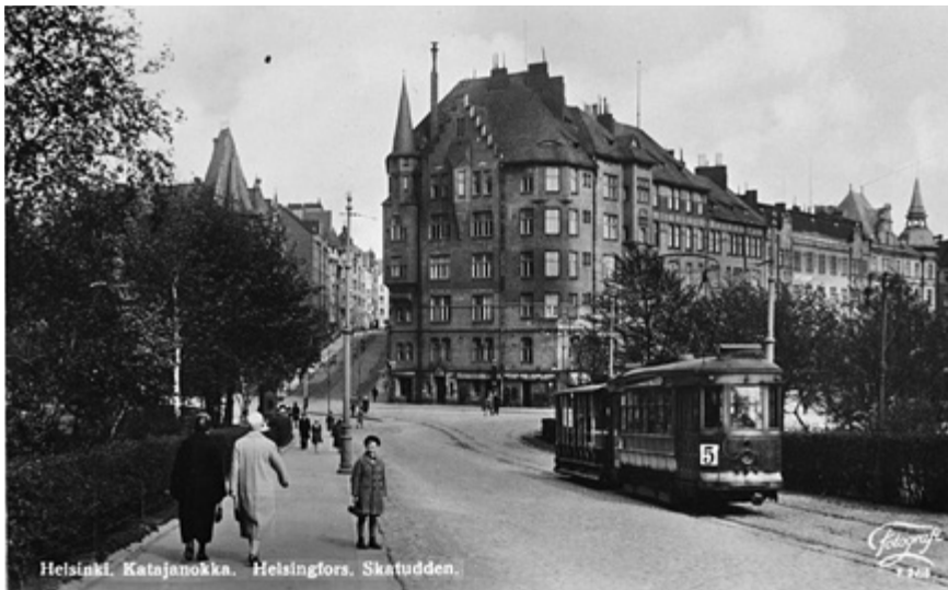
Raitiovaunu kulki Luotsikadulle 1970-luvulle asti läpi nykyisen Tove Janssonin puiston.