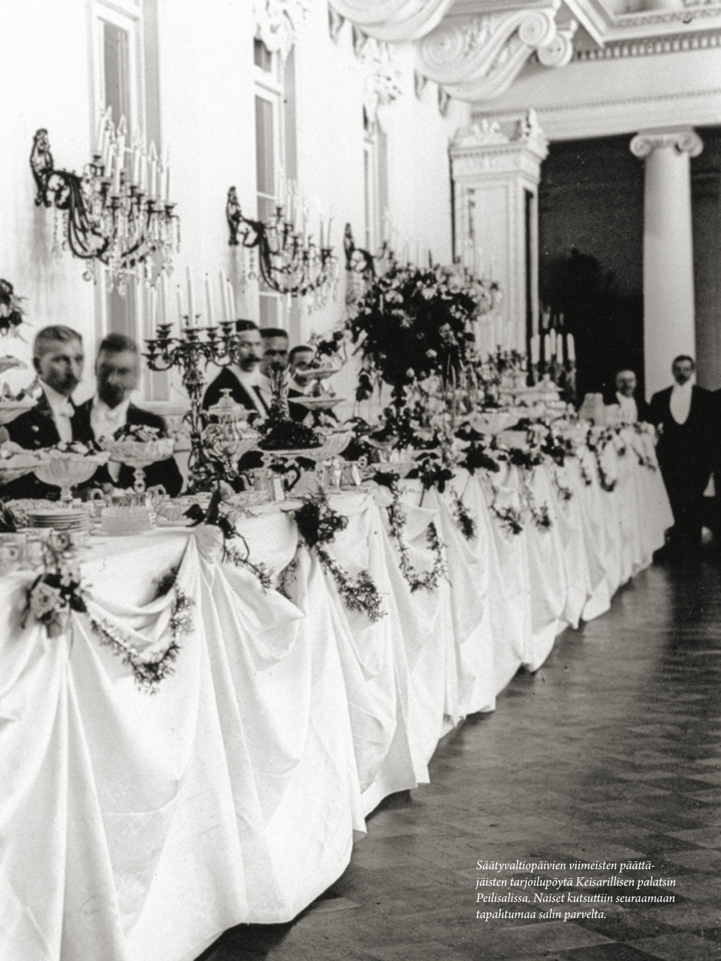
Säätyvaltiopäivien viimeisten päättä- jäisten tarjoilupöytä Keisarillisen palatsin Peilisalissa. Naiset kutsuttiin seuraamaan tapahtumaa salin parvelta.