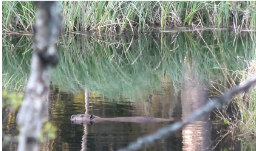
Justin Beaver elementissään kotikonnuilla.

Illan täydensi vielä peilitynyn järvenpinnan rikkonut loiskahdus. Majavakolmikko ilahdutti ja palkitsi meidät uimalla majasteettisesti useaan kertaan editsemme ja outoa hajujälkeä ympäristöön leivittänyttä avioparia tutkien. Liikkumattomina ja henkeä pidättäen annoimme kameroidemme vangita luonnon näytelmän. Uhaksi majavat eivät meitä kokeneet. Ilmiselvästi ne olivat jo tottuneet läsnäoloomme.