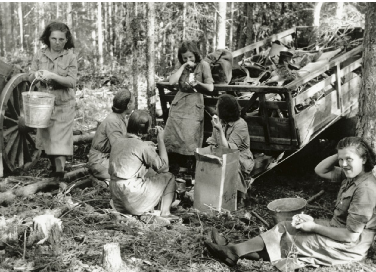
VASEMMALLA: Lottia tauolla heinäkuussa 1941. Lottia oli aseettomassa maanpuolustuksessa rintamalla asti.