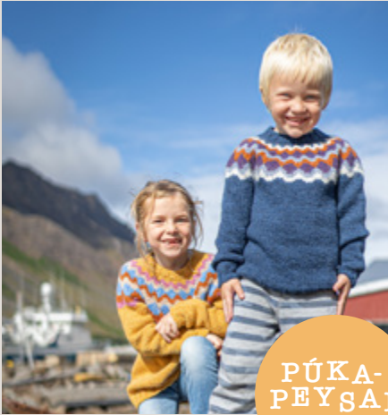
PÚKA- PEYSAN 104