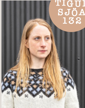
TÍGUL- SJÖA 132