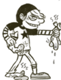
SUKKAMEHU-SEBU TÄINNUTTAVA JALKAHÄN HÄJU