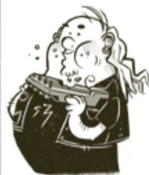
SYÖMÄRI-SEPPÖ SYÖ MITÄ VÄÄN, MISSÄ VÄÄN, JÄ MÄLLÖN VÄÄN