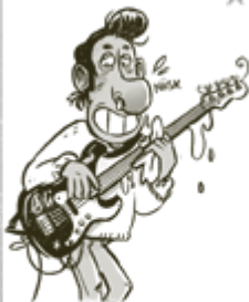
ALLERGIA-ÄLI POIKKEUKSELLINEN RÄÄN ERITYS