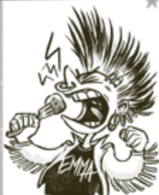
EMMA EPÄVIREINEN LÄMÄÄNUTTAVA EPÄVIREINEN LÄULU