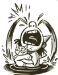
ITKU-ISLA VOIMAKAS ITKU