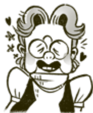
UNETTAVA-ULLA NUKUTTAÄ KUULLIJÄT