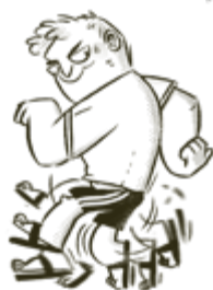
TAKAPERIN-TÖRSTEN PUHUU JÄ LIKKUU TÄKÄPERIN