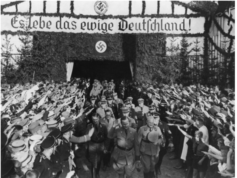
"Eläköön ikuinen Saksa!" Paikalliset natsit toivottavat Alfred Rosenbergin tervetulleeksi Heiligenstadtin Thüringeniin 1935.